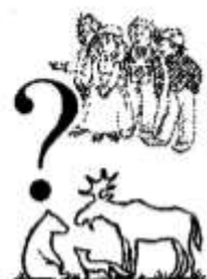
4. Как выглядели люди и животные?