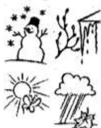
1. В какое время года произошли события?