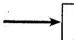
7. Чем могла закончиться история?