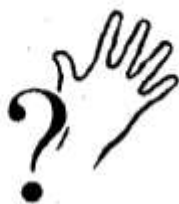
3. Что делали люди и животные?