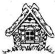
2. Где произошли события?