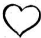
6. Чем вам понравилась картина?