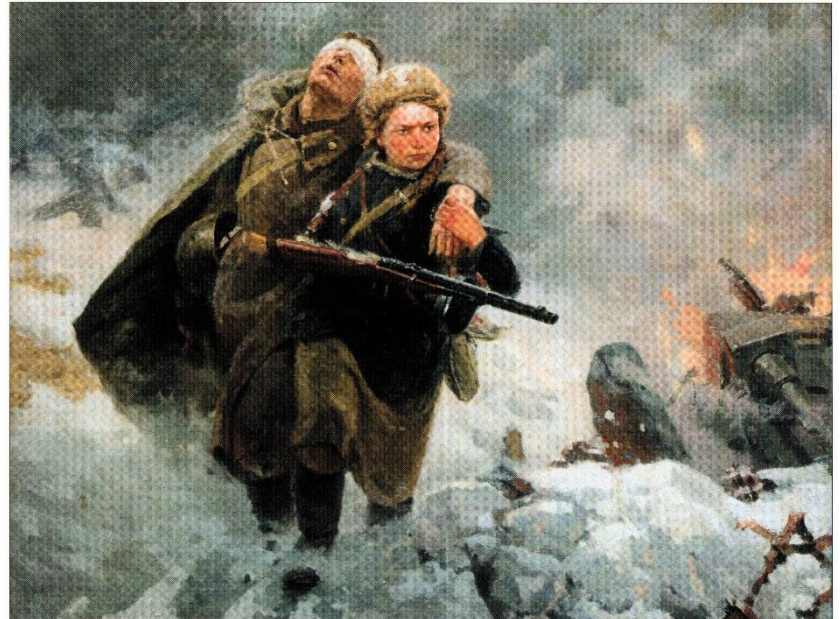
М. И. Самсонов. «Сестрица» (фрагмент). 1954 г.

Вместе с юношами отважно сражались на поле боя и девушки. Автору удалось изобразить женщину в образе мужественной девушки, которая вынуждена быть медсестрой. Она вытаскивает с поля боя раненого солдата. У