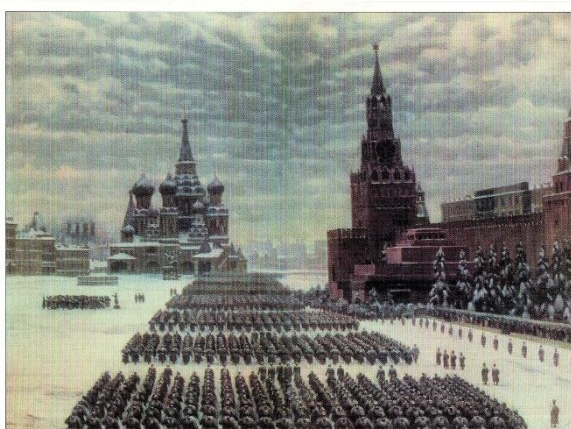
К. Ф. Юон. «Парад на Красной площади в Москве 7 ноября 1941 года». 1949 г.

1418 дней и ночей длились невиданные по размаху и ожесточенности сражения. И с первых же дней войны, надев солдатские шинели, ушли на фронт в качестве бойцов, командиров, политработников, корреспондентов фронтовых газет многие писатели, поэты, художники. Они прошли трудными боевыми дорогами, деля с солдатами всю тяжесть фронтовой жизни, суровые испытания человеческого духа, мужества, героизма. И дорожный альбом художника запечатлевал огненные мгновения истории.