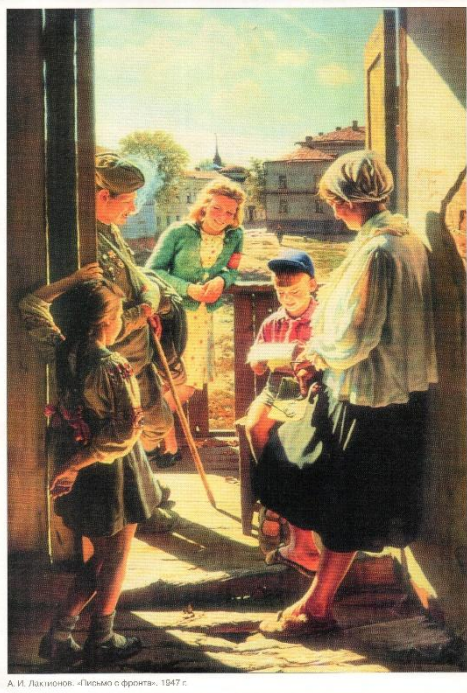
А. И. Лактионов. «Письмо с фронта». 1947 г.

мощным клином, сметая сопротивление массы врагов. Огромная фигура матроса на первом плане, которая с трудом вмещается на полотнище, дана в острейшем ракурсе. Его яркость и сила воплощают в себе мощь народной войны против фашизма. На тесной полоске прибрежной земли вплотную, врукопашную столкнулись два мира. Художник решает картину как противоборство света и тьмы.