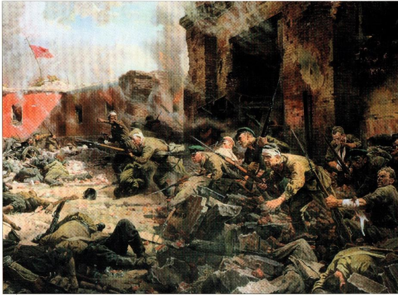
П. А. Кривоногов. «Защитники Брестской крепости» (фрагмент). 1951 г.