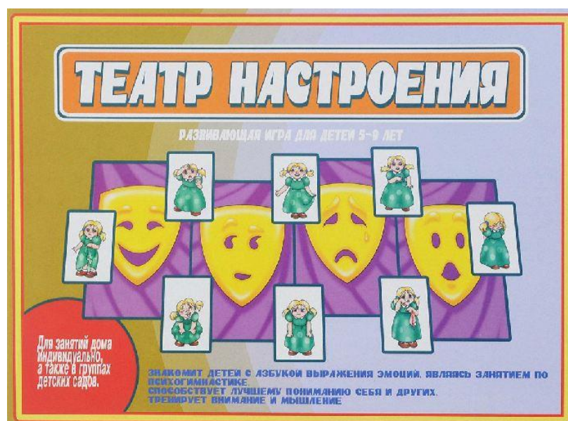
Игра Театр настроения

Увлекательная игра, которая познакомит ребенка с разными эмоциями и научит его их выражать. Магнитное двустороннее поле позволяет собирать картинки из готовых элементов или рисовать их с помощью водорастворимого маркера. Суть развивающей игры состоит в том, чтобы ребенок собрал выражение лица, используя магнитные детали. Так же на игровом поле малыш может попробовать изобразить картинку с эмоциями, которые ему показывает взрослый.