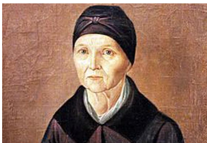
Няня А.С. Пушкина Арина Родионовна