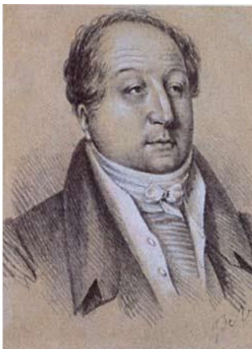
Дядя А.С. Пушкина Василий Львович