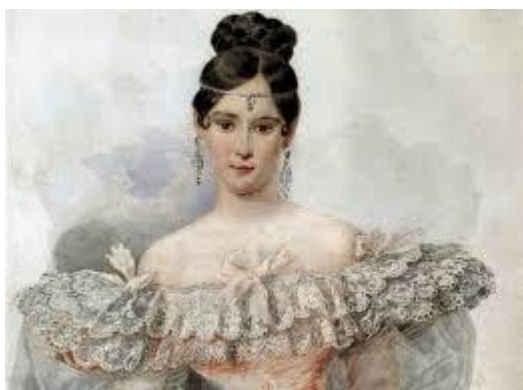
Жена А.С. Пушкина Наталья Николаевна