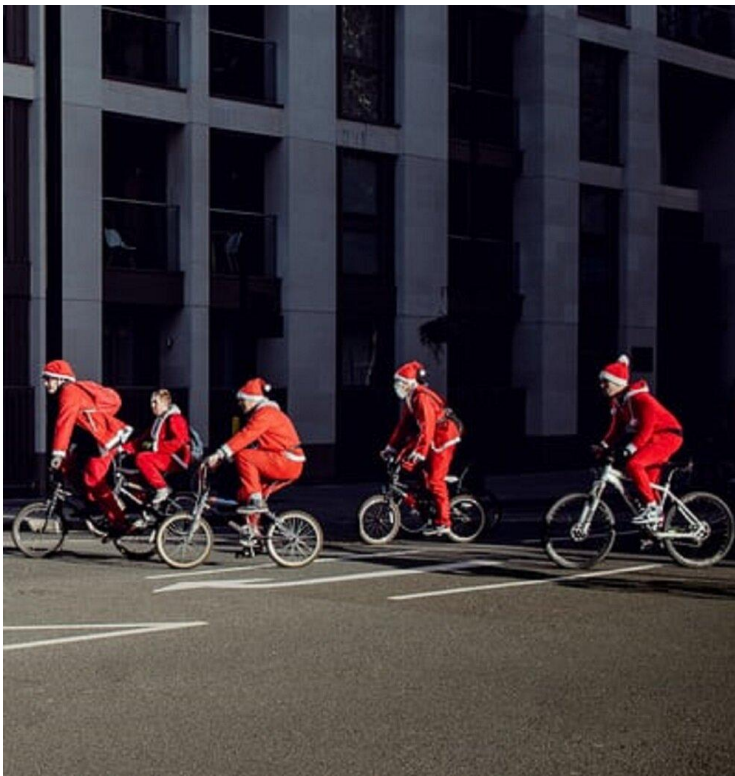
Современное использование велосипедов

Праздник велосипеда - не просто событие, собирающее миллионы взрослых и детей на площадях и трассах всего мира. Это напоминание о том, насколько важным изобретением в свое время стало такое обычное