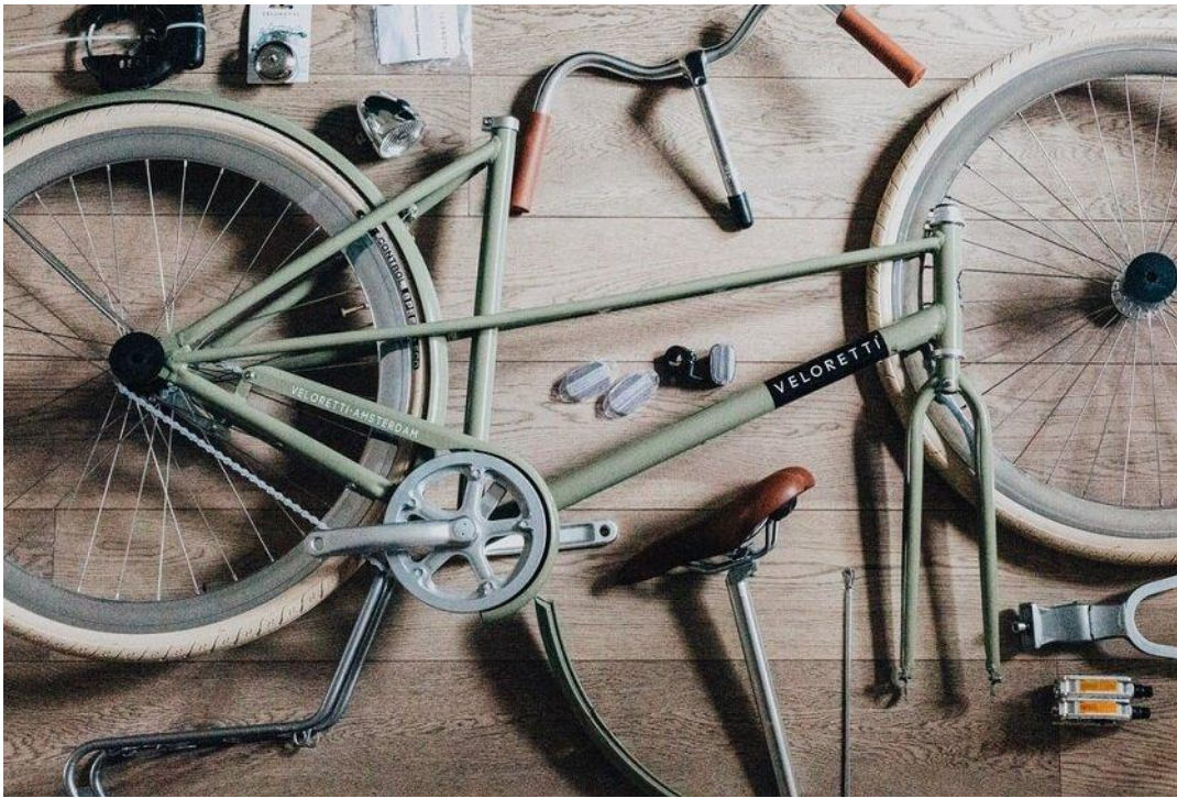
Разобрать велосипед просто