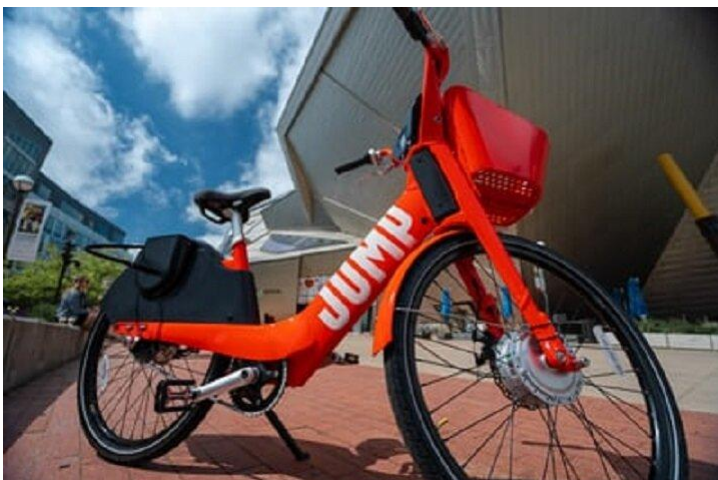
Велосипед для прыжков